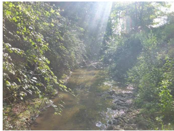
Le Médier en aval Monqauzy