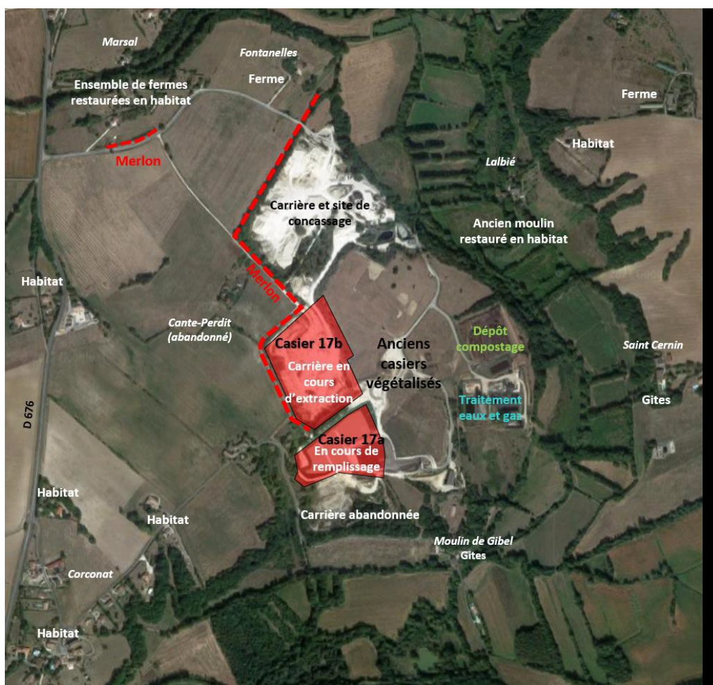
Figure n°2 – Contexte du projet

Le casier 17b sera raccordé au réseau de biogaz. Le reste de la gestion du biogaz sera inchangé, le surpresseur ayant la capacité suffisante pour récolter le biogaz produit par l'ensemble des casiers.