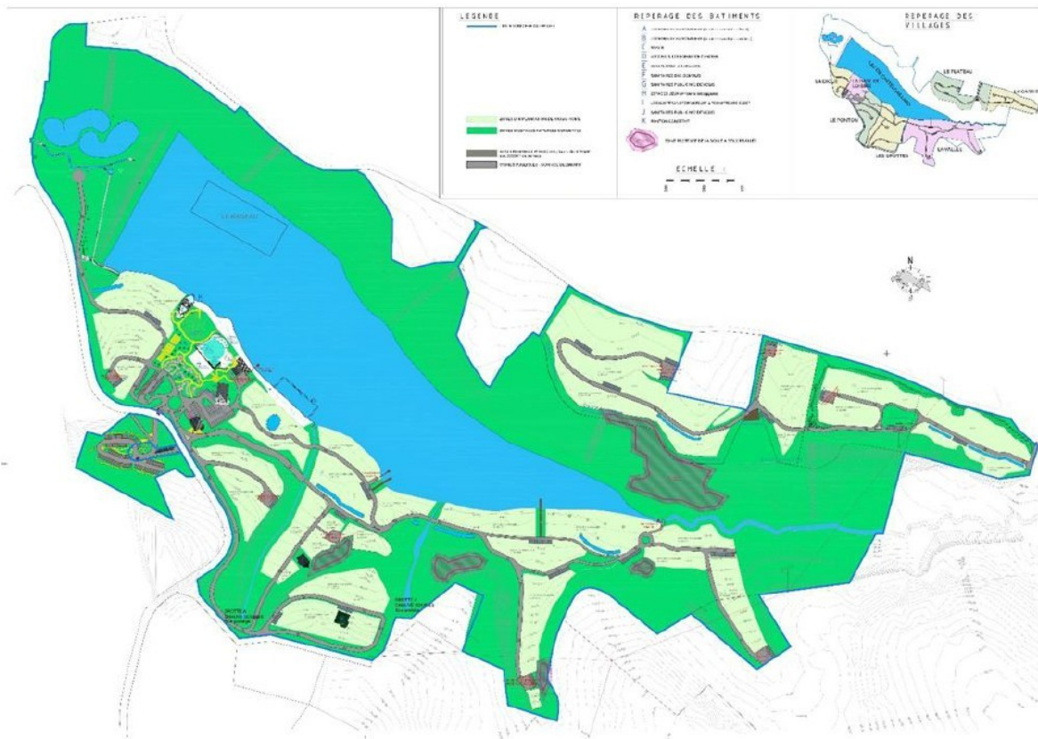
Figure 4 : Emprise générale du projet autour du Lac de Castelgaillard

Afin de recréer un complexe attractif, le projet prévoit la rénovation de la base de loisirs existante, avec piscines, jacuzzi, toboggans, mini-golf, 8 bouldromes, une aire multi-jeux, un amphithéâtre au bord du lac, des parkings, un restaurant et un snack. Il est également prévu l'aménagement de 400 emplacements pour résidences mobiles de loisirs de type mobil-home, dont une partie sur l'emprise de l'ancien camping, ainsi que la réalisation d'installations annexes nécessaires à la gestion des réseaux (eaux pluviales et eaux usées).