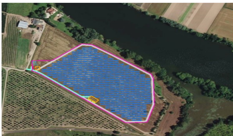
Figure 23 : Projet de février 2020

Source : Étude d'impact Centrale photovoltaïque au sol de Griffoul, Mémoire comparatif des évolutions du projet p. 37 et 40