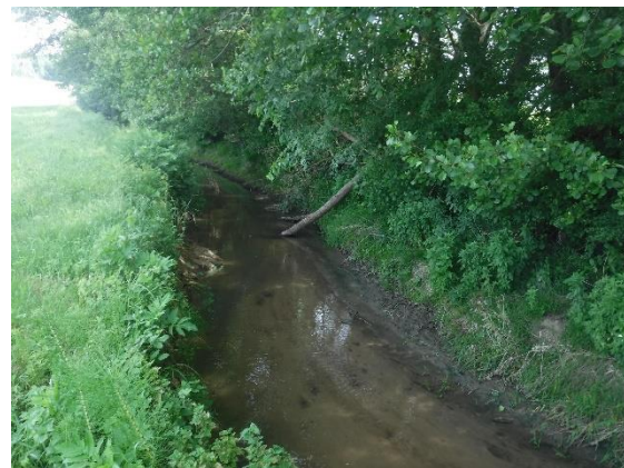
L'Ourbise à Razimet