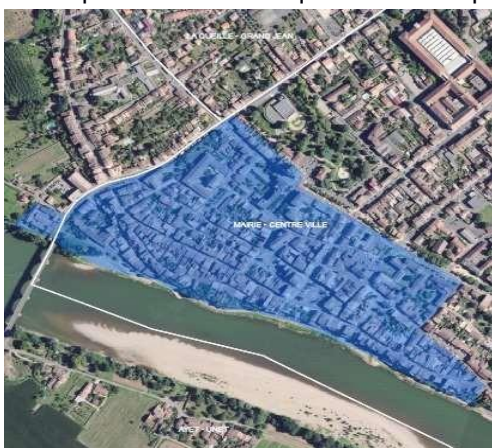
Quartier « Cœur de Ville » (Tonneins)

Elle se déploie au sein des quartiers dits « prioritaires » :