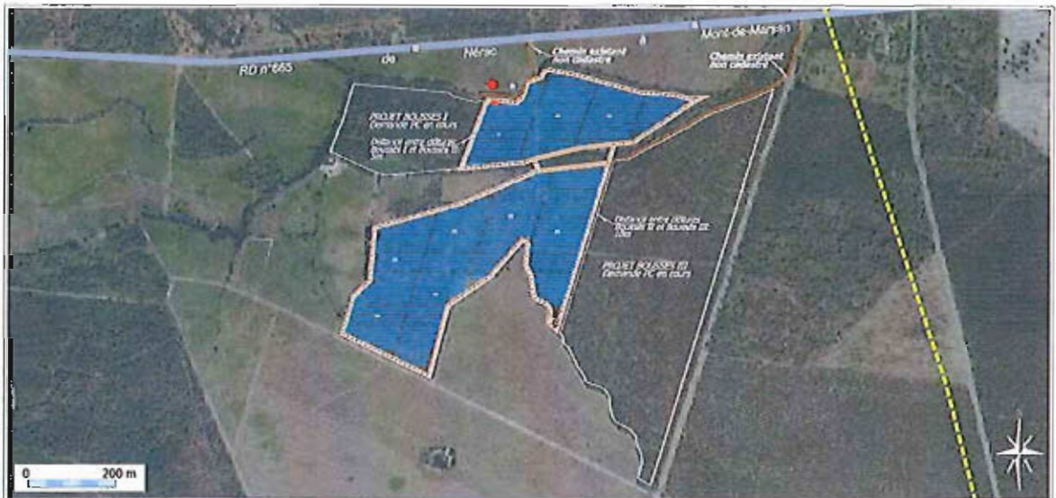
Plan du projet de Boussès II - Cartographie extraite de l'étude d'impact

Le projet est soumis à étude d'impact en application de la rubrique n°26 du tableau annexé à l'article R122-2 du Code de l'Environnement. Il est par ailleurs soumis à la procédure d'autorisation au titre du défrichement et à demande de permis de construire. Le présent avis est établi dans le cadre de la demande de permis de construire.