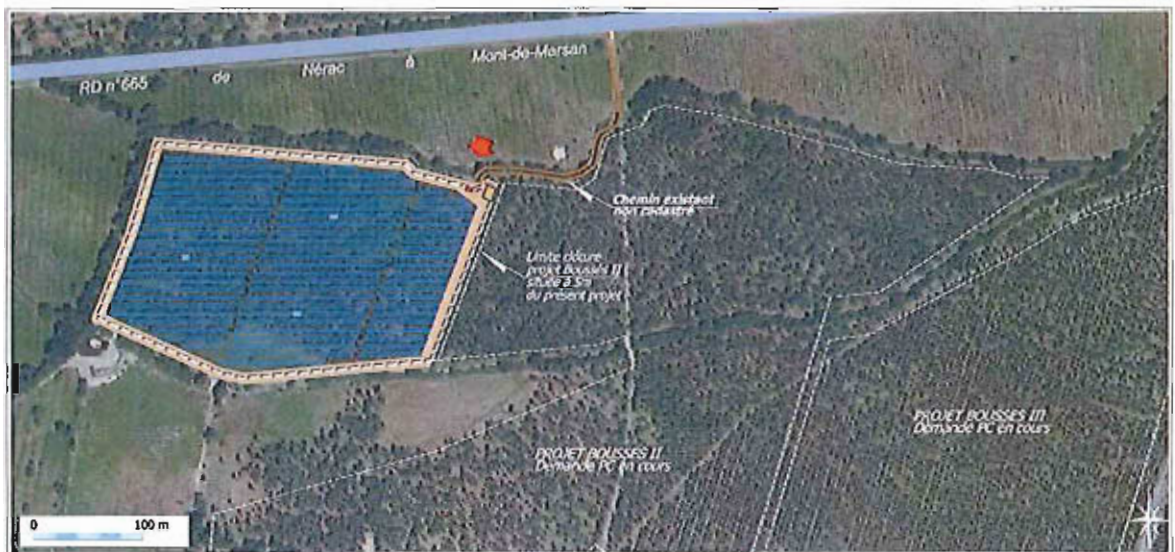
Plan du projet de Boussès I - Cartographie extraite de l'étude d'impact

Le projet est soumis à étude d'impact en application de la rubrique n°26 du tableau annexé à l'article R122-2 du Code de l'Environnement. Il est par ailleurs soumis à la procédure d'autorisation au titre du défrichement et à demande de permis de construire. Le présent avis est établi dans le cadre de la demande de permis de construire.